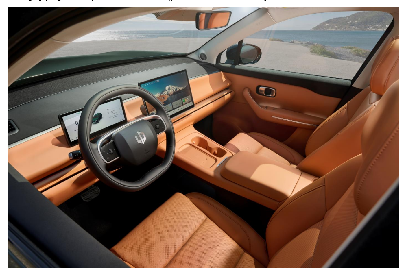
Wykończenie wnętrza C10 Design w kolorze Criollo Brown

Szczegóły programu dopłat "NaszEauto" dostępne na stronie internetowej NFOŚiGW.