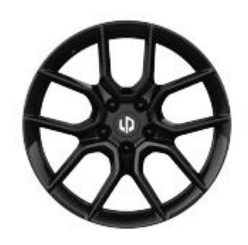
18" felgi aluminiowe (wersja Style)