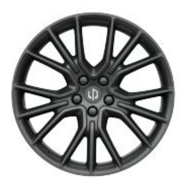
20" felgi aluminiowe (wersja Design)